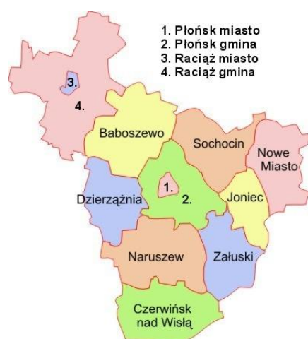
Położenie Gminy Raciąż na mapie powiatu płońskiego

Siedzibą władz Gminy jest miasto Raciąż. Gmina jest młodą jednostką administracyjną. Do roku 1992 wchodziła w skład gminy miejsko-gminnej Raciąż. Jest największą gminą wiejską w powiecie płońskim. Zajmuje powierzchnię 24286,91 ha (242,9 km 2 ) co stanowi niemal 17,6% powierzchni całego powiatu płońskiego.