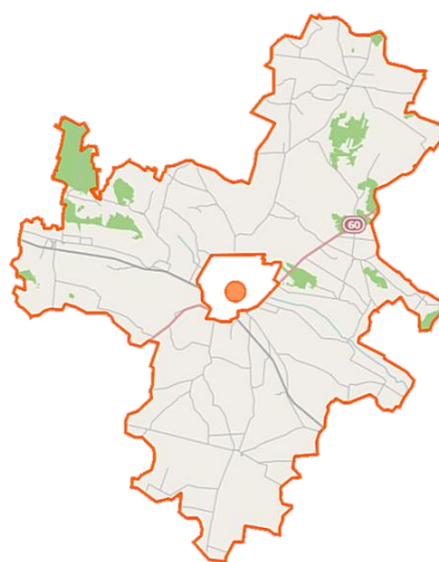
Mapa Gminy Raciąż

Gmina ma charakter rolniczy, produkcja rolna prowadzona jest na dobrych warunkach przyrodniczo-glebowych, w tradycyjnie wysokiej kulturze rolnej.